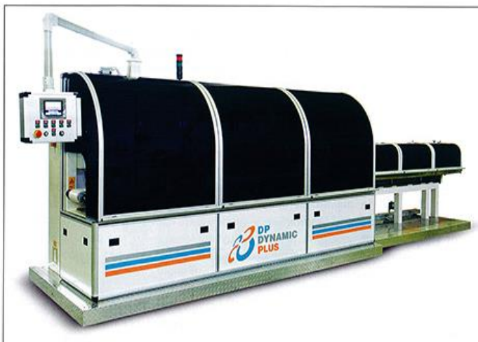
Автоматическая упаковочная линия DYN-WA-120. Лента конвейера с антибактериальным покрытием, хромо-никелевое качественное покрытие поверхностей соприкосновения с продуктом, сервоприводы

хороших ценах, мы начали искать партнера-изготовителя упаковочных машин. Но поиски к успеху не привели, и в итоге мы решили самостоятельно их изготавливать. По цене, качеству и производительности они в короткие сроки получили признание со стороны заказчиков. Затем, расширяя ассортимент, новая