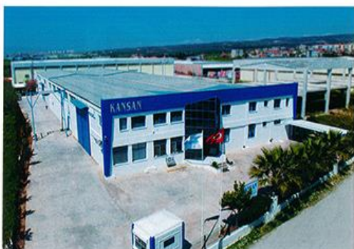
Здание завода компаний KANSAN и DP Dynamic Plus в крупном турецком промышленном центре — г. Измир