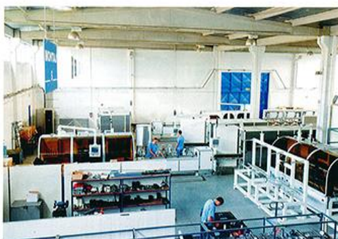
В сборочном цехе завода: идет монтаж линий для упаковки влажных салфеток DYN-WA-120

компания наладила и производство линий для пищевой упаковки.